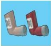
キュパール (50µg, 100µg)