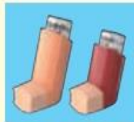
フルタイドエア (50µg, 100µg)