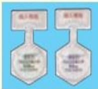
パルミコート吸入液 (0.25mg, 0.5mg)