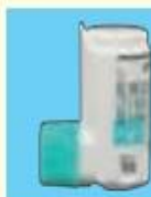
メプチン エア (10µg吸入100回)