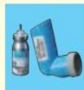
アイロミール エアゾール (100µg)