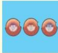
フルタイドディスクス (50, 100, 200)