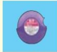
アドエア 100ディスクス*