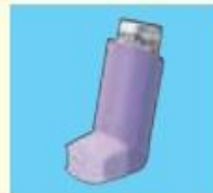
アドエア 50エアゾール*