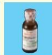
ベネトリン吸入液 0.5% (30ml)