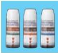
パルミコート タービュヘイラー (100µg, 200µg)