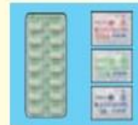
左:オノンカプセル(112.5mg) 右:オノンドライシロップ10% (50mg, 70mg, 100mg)