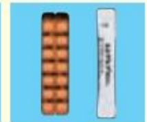
左:シングレアチュアブル錠 (5mg) 右:シングレア細粒(4mg)