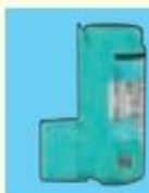
メプチン キッドエア (5µg吸入100回)