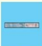
メプチン 吸入液ユニット (50µg, 100µg, 200µg)