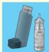
サルタノール インヘラー (100µg)