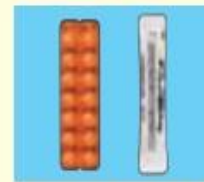
左:キプレスチュアブル錠 (5mg) 右:キプレス細粒(4mg)

その他にクロモグリク酸ナトリウム(インタル®)、テオフィリン薬、長時間作用性β 2 刺激薬、Th2サイトカイン阻害薬(アイピーディ®)などがあります。*吸入ステロイド薬と長時間作用性気管支拡張薬の配合剤