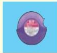
アドエア 100ディスクス*