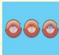
フルタイドディスクス (50, 100, 200)