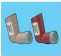
キュパール (50μg, 100μg)